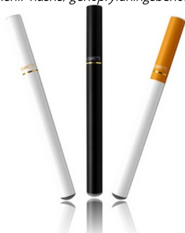
Fig. 5 - Typer af engangsanvendelige e-cigaretter - de kan evt. også være genanvendelige, ved at anvende udskiftelige patroner som det ses i fig 6 - billede 1, 2 og 3