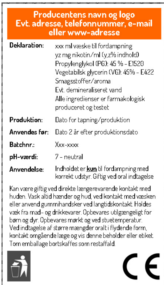
Fig 1. Forslag til varedeklaration, der skal være på bagsiden af alle flasker med nikotinholdige produkter til fordampning. Forsiden af emballagen fritholdes til etiket der angiver produktets varemærke/navn samt forklarer variant/type af indhold, samt evt. den påkrævede tekst fra TPD Art. 20, stk. 4, iii - eller den til enhver tid gældende krav om mærkning.