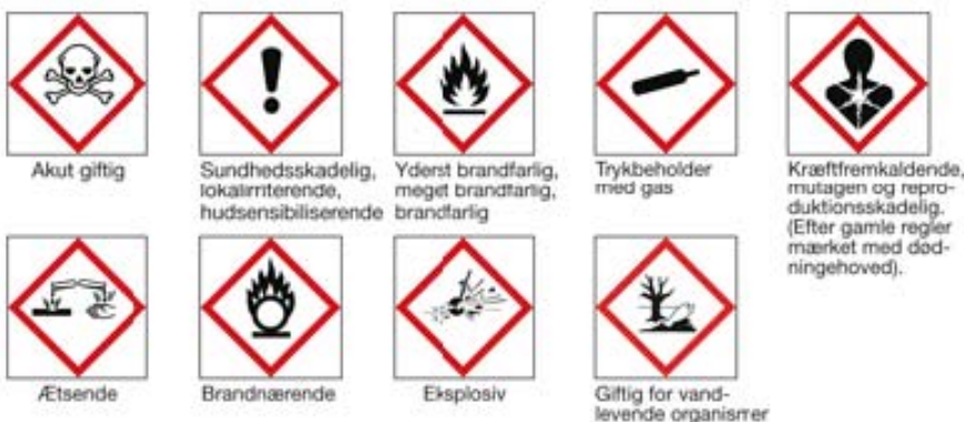
Fig. 2: De nye faresymboler - hvor "Akut giftig" og "Sundhedsskadelig" (lokalirriterende, hudsensibiliserende) er de to symboler der evt. kan være gældende for nikotinholdige væsker, der er dog stor diskussion om hvorvidt der kan stilles krav om mærkning med faresymboler overhovedet. For mere information ang. krav til mærkning af nikotinholdige produkter, se venligst denne redegørelse foretaget af "Bibra, Toxicology Advice and Consulting" for ECITA, Electronic Cigarette Industry Trade Association:

http://www.ecita.org.uk/ecita-news/e-cigarette-liquid-not-highly-toxic-it%E2%80%99s-less-dangerous-washing-liquid